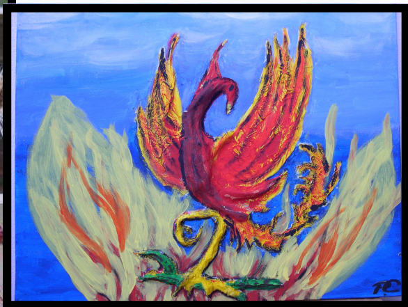
OUTSIDER-ART UND NATIVES MALEREI COLLAGE TEXTILES

Mitmischer nennen sie sich , weil ihnen daran gelegen ist , aktuelle und auch brisante Themen künstlerisch zu verarbeiten.